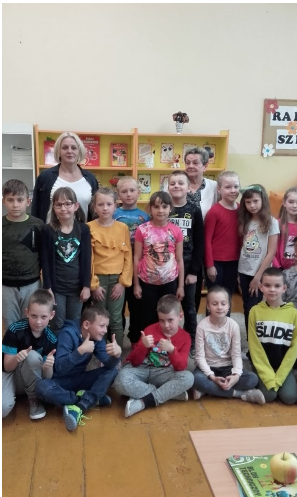
Publiczna Szkoła Podstawowa w Jedlni