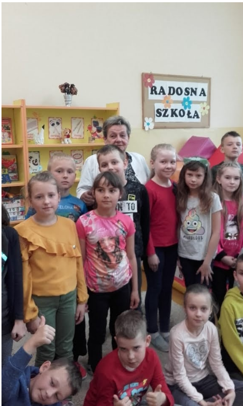
Publiczna Szkoła Podstawowa w Jedlni